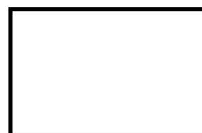
Desenho 4 – Representação uma micela esférica