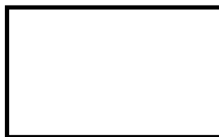
Fotografia 1 – Células de levedura de brotamento